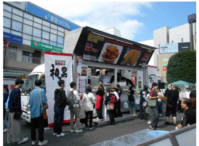
所沢プロペ商店街振興組合